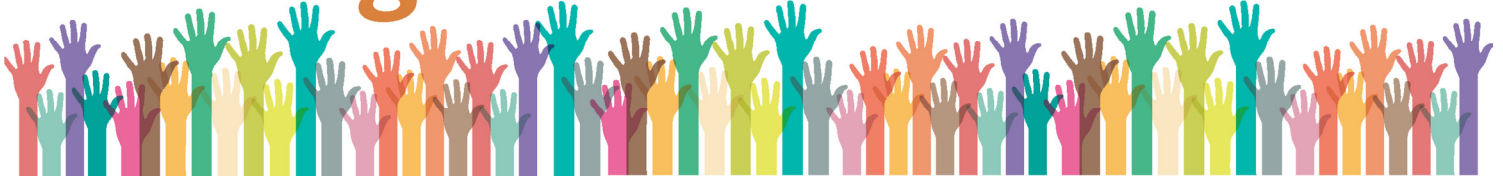
Foto 1 - Lançamento do Dialoga Brasil Digital, julho de 2015.