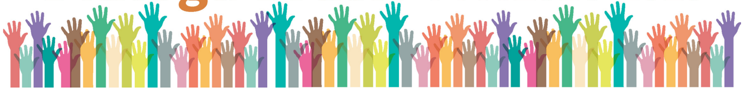
Figura 2 - Representação da participação social na elaboração do PPA 2016-2019.