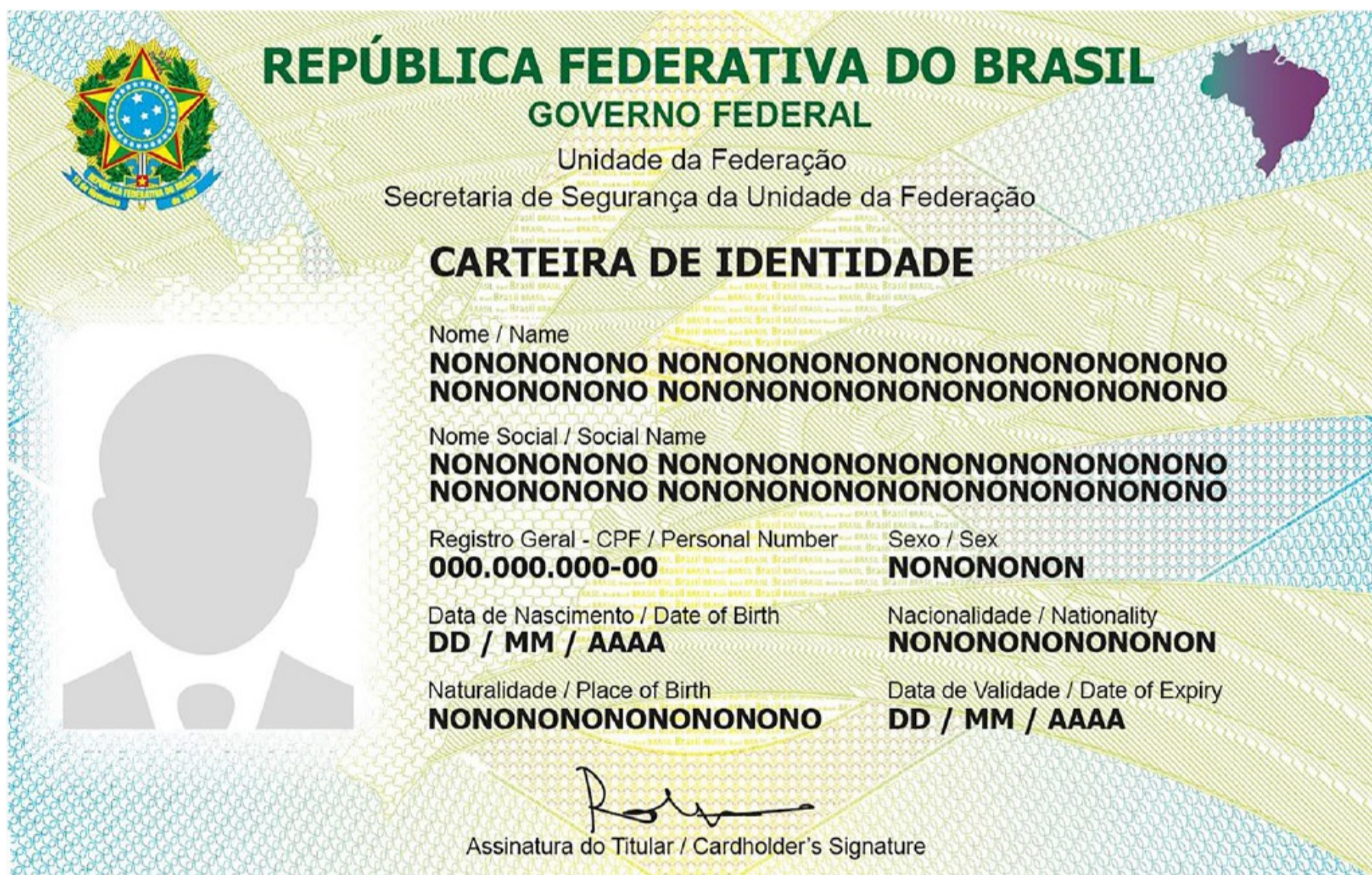
Figura 2 - Imagem do reverso da Carteira de Identidade

com todos os elementos visíveis e variáveis