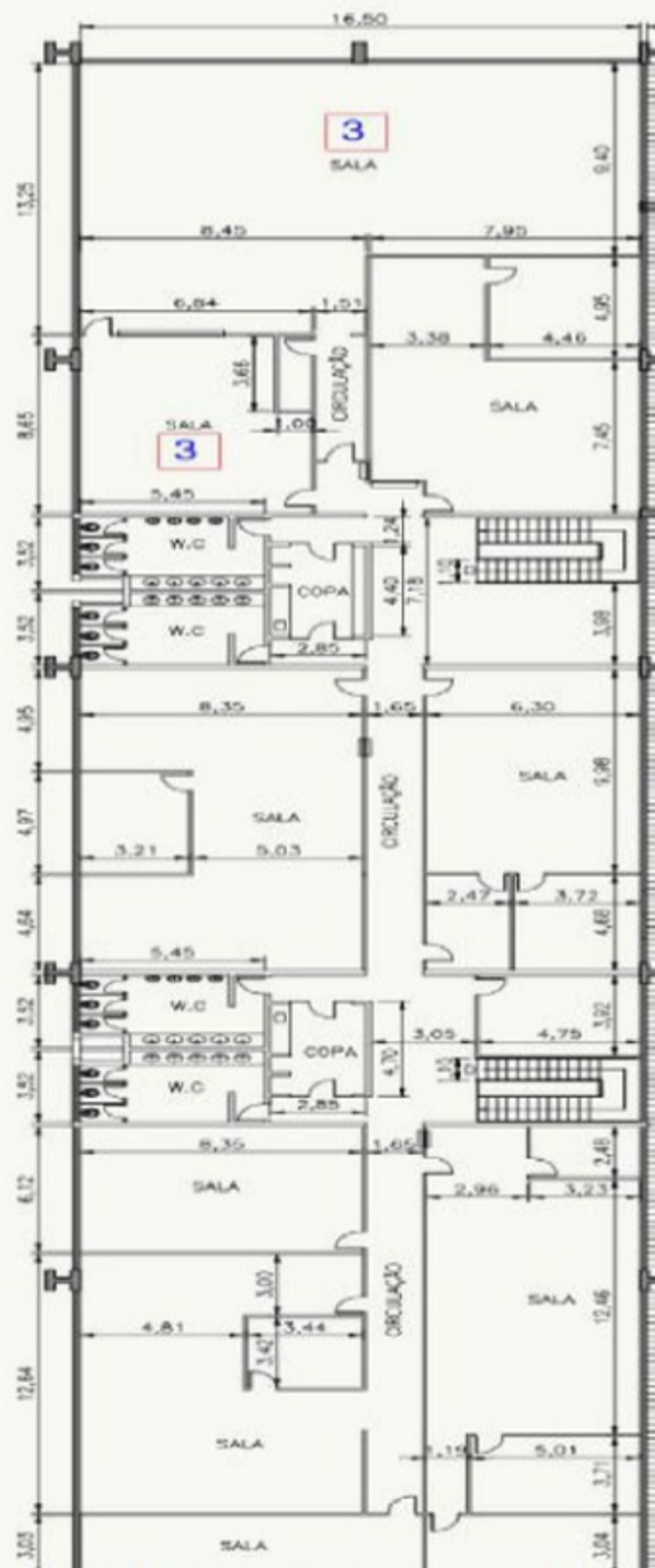
Edifício 1 - TECA Importação - 1º Andar