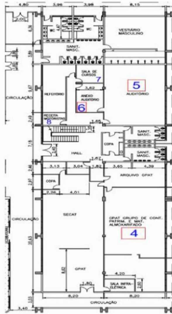
Edifício 2 - TECA Exportação - Piso Térreo